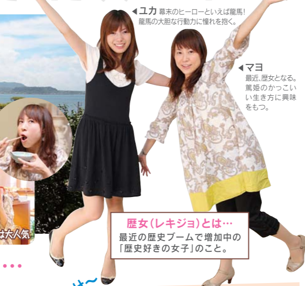
▲ユカ 幕末のヒーローといえば龍馬! 龍馬の大胆な行動力に憧れを抱く。