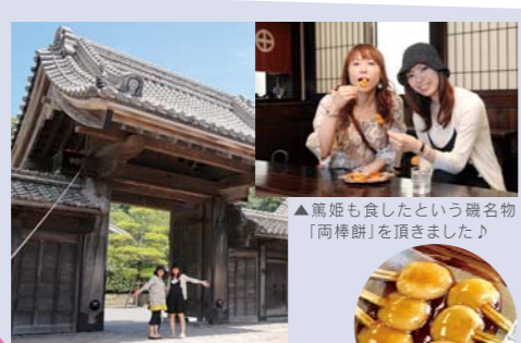
▲篤姫も食したという磯名物「両棒餅」を頂きました♪

CLUBカードで20%OFF ※上記3店舗限定。2009年12月31日まで ※他の割引との併用はできません。