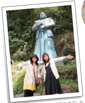
▲西郷隆盛が最期の5日間を過ごした場所「西郷洞窟」にて