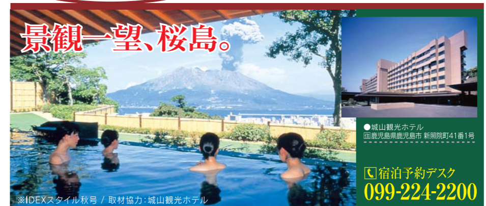
※IDEXスタイル秋号 / 取材協力: 城山観光ホテル