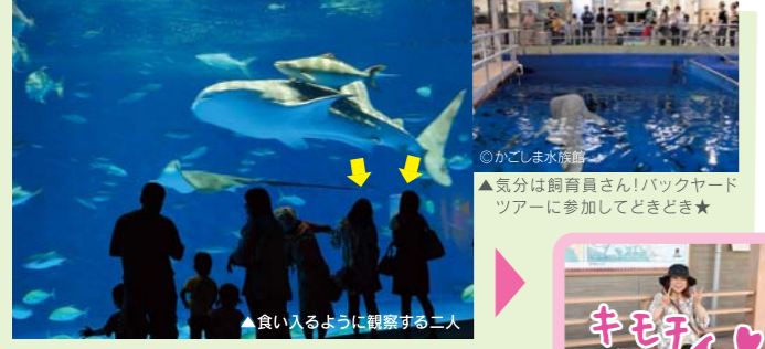
▲食べ入るように観察する二人