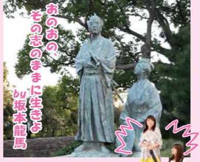
▲坂本龍馬とおりようの銅像

◎入館料:常設展 大人300円、高・大学生190円、小・中学生120円 ※常設コーナーは無料