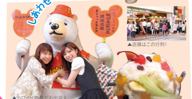
▲カワイイ白熊がお出迎え

◎099-247-1551 ①普通車500台(1回300円) ②開園8:30~17:20(開園時間) ※年中無休 ③庭園コース入館料:大人1000円、小人500円 ④御殿コース入館料:大人1500円、小人750円 ※御殿コースのご案内時間は午前9時~午後4時40分まで