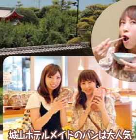
城山観光ホテルのパンは大人気