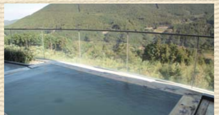
露天風呂から望む絶景。お肌も心も潤いますね...

【住】長崎県佐世保市三浦町 4-8 【営】11:00~21:00 【休】火曜 【席】22席 【P】なし (近くに有料Pあり)