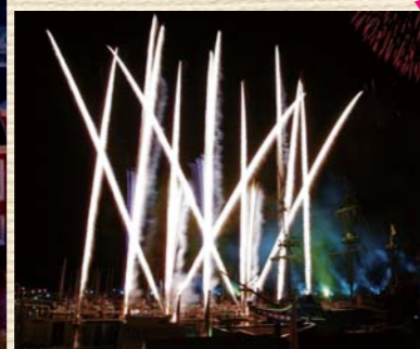
カウントダウン花火は 18:00~ 24:00 の 2 回 (予定)