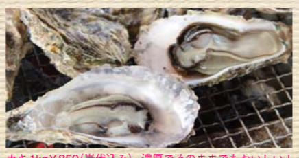
カキ 1kg ¥850 (炭代込み)。濃厚でそのままでもおいしい!

佐世保湾に浮かぶ船を利用したカキ小屋で、旬のカキを豪快に炭火で焼いて食べられます。軍手やナイフは無料貸し出し、飲み物やおにぎり、調味料は持ち込みOK。うまみたっぷり、ぷるぷるのカキをどうぞ!