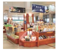
舶来の匠 (¥2620・左) 五三焼カステラ (¥2100・右)

和泉屋 佐世保大塔インター店 ☎0956-58-4000 【住】長崎県佐世保市指方町 1 【営】8:30~17:30 【休】なし 【P】50台