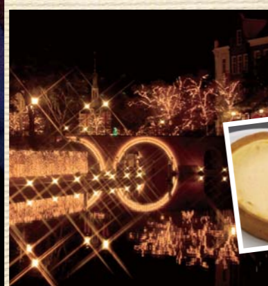
光に包まれとっても幻想的な運河の光景