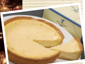
ラフレシールのチーズケーキプレーン味(¥1260)は、これを目当ての方もいるほど人気です!

【住】長崎県佐世保市ハウステンボス町 1-1 【営】~1/6(水) 9:00~20:00 (最終入場)、1/7(木)~2/28(日) は 9:00~19:00 (最終入場) 【休】なし 【料】パスポート大人 ¥5600、中高生 ¥4400、4歳~小学生 ¥3400 【P】6000台 (¥800 / 1日)