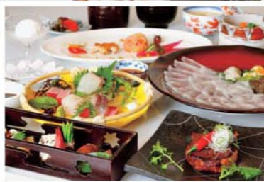
大分の冬の味がぎゅっとつまった、料理長こだわりの会席 ※季節及び仕入れにより、内容は変わります。