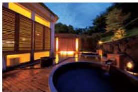
なめらかな肌触りの天然温泉。露天風呂は満天の星空のもと癒されます。

大分名物の料理や旬の食材を使ったバイキングも、城島人気のひとつ。冬はズワイガニ入り!