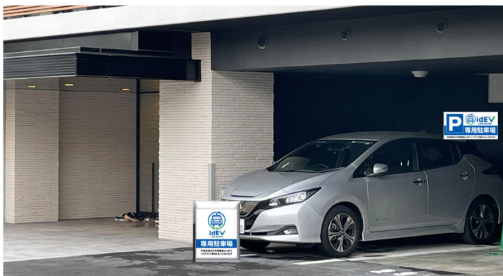
※上記画像はイメージとなります