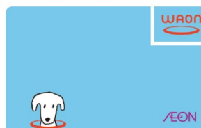
×電子マネーWAONカード

イオンクレジットカード・チャージ式 WAON はポイント付与の 対象外 となります。