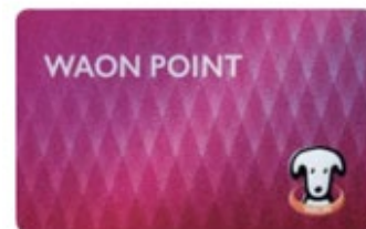
WAON POINT カード

その後は、各月末までに「WAON POINT」カード番号を登録いただくと、当月ご利用分(翌月ご請求分)より「WAON POINT」の付与をスタート。